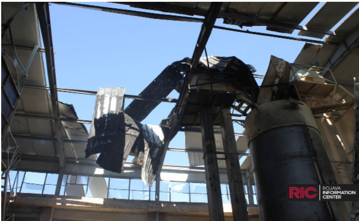
Un centre agricole bombardé par des drones turcs à Qamishlo 25.10.2024