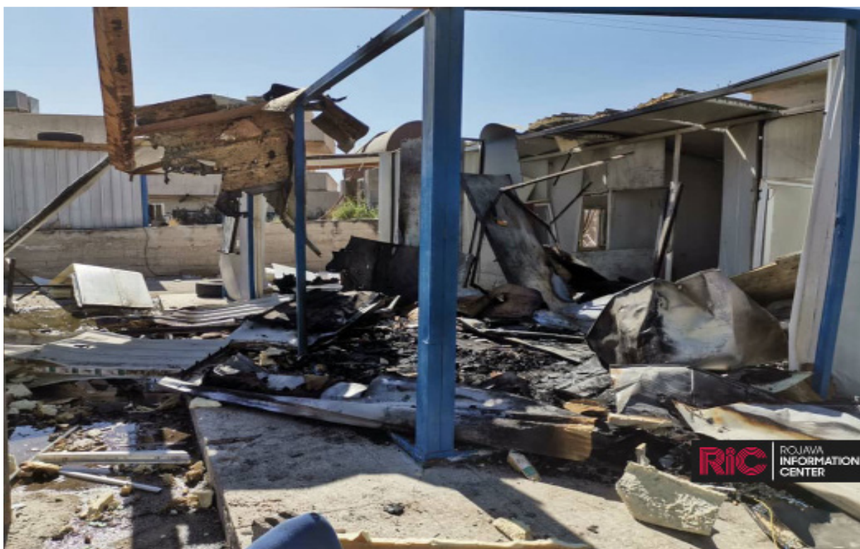
Un entrepôt de blé bombardé par des drones turcs à Kobané 25.10.2024