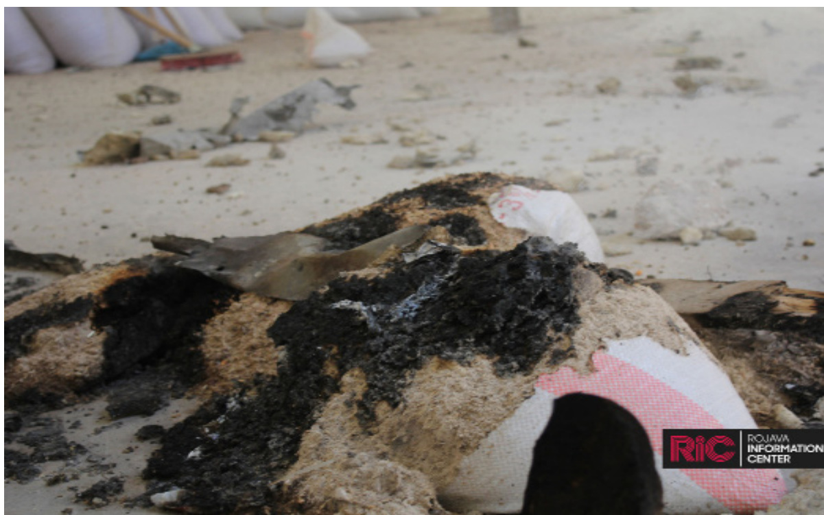
Un centre agricole bombardé par des drones turcs à Qamishlo 25.10.2024

Aujourd'hui, la branche armée du Parti des travailleurs du Kurdistan (PKK) a revendiqué la responsabilité de l'attaque des équipements aéronavals à Ankara qui a eu lieu le 23 octobre - après quoi la dernière série de frappes aériennes a commencé. L'administration autonome démocratique du NES (DAANES) a publié une déclaration qui accuse la Turquie d'« exporter ses crises internes » et dénonce le « silence international » qui entoure les attaques contre les infrastructures civiles.