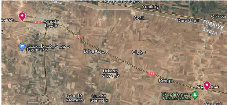
Frappes aériennes turques sur Amude 25.10.2024