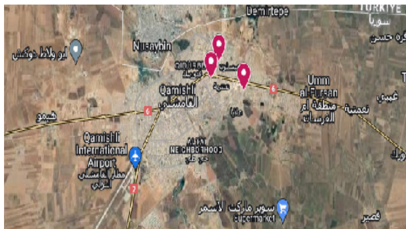
Frappes aériennes turques sur Qamishlo 25.10.2024