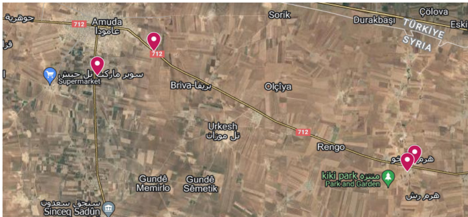
Frappes aériennes turques sur Amude, 24.10.2024