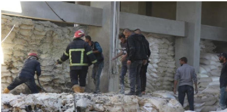
Des silos à grains bombardés par des drones turcs à Qamishlo 24.10.2024

-Le Centre d'information de Rojava est disponible pour fournir des commentaires sur le terrain, ainsi que des photos et des vidéos des sites de frappes aériennes et des contacts avec les représentants politiques et le personnel humanitaire pour des commentaires.