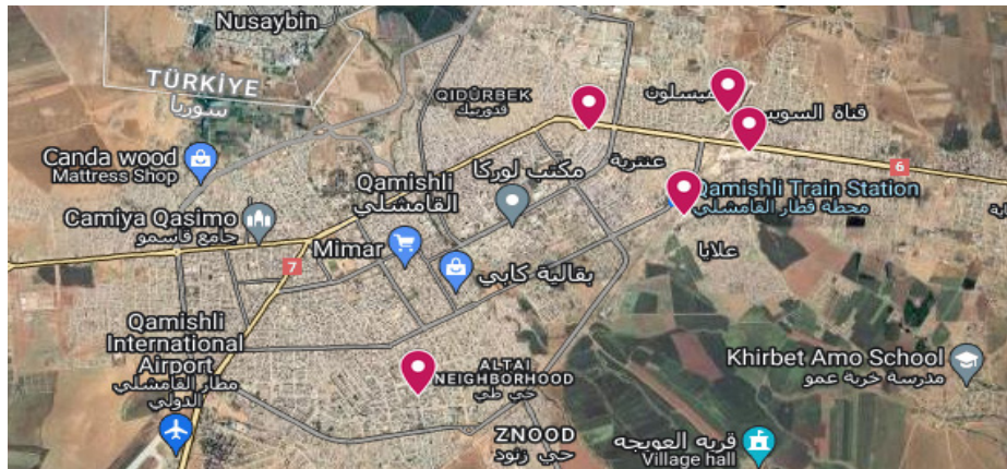
Frappes aériennes turques sur Qamishlo, 24.10.2024

1. Centre des Asayish (Forces de sécurité intérieure), Qamishlo; 2. clinique Khalij, Qamishlo ; 3. point de contrôle des Asayish, Qamishlo ; 4. usine alimentaire, Kobané ; 5. centrale électrique, Amude ; 6. Merka Mira, Derik ; 7. centrale électrique de Kobané (3) ; 8. Site industriel de Sadcop, Qamishlo ; 9. silos à grains, Qamishlo ; 10. centrale électrique de Saida, Tirbespi ; 11. boulangerie, Kobane ; 12. station de gaz et d'électricité de Suwaydiyah, Tirbespi ; 13. site de la raffinerie de carburant de Tafla, Derik ; 14. gare, Qamishlo ; 15. Poste de contrôle d'Asayish, Kobané ; 16. Boulangerie, Amude ; 17. Centrale électrique, Amude ; 18. A proximité de la Faculté d'ingénierie pétrolière et pétrochimique, Rimelan ; 19. Eyin Tewil, Rimelan ; 20. Centre Asayish, Qamishlo ; 21. Station Babasi, Tirbespi ; 22. Station pétrolière de Zarba, Tirbespi ; 23. Station Awda, champ pétrolifère d'Odeh ; 24. Tour Syriatel, Darbasiyah ; 25. Champ pétrolier d'Odeh, Tirbespi