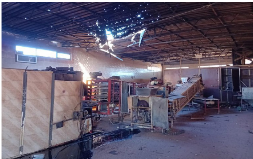
Une boulangerie à Amude bombardée par des frappes aériennes turques, 24.10.2024

La Turquie a lancé ces frappes aériennes à la suite d'un attentat perpétré à Ankara le 23 octobre, que les autorités turques ont attribué à des membres du Parti des travailleurs du Kurdistan (PKK). Aucun groupe n'a revendiqué l'attaque. Par le passé, les dirigeants politiques et militaires de la NES ont déclaré que les attaques de la Turquie constituaient des crimes de guerre et ont nié les affirmations de la Turquie selon lesquelles le PKK organisait ses attaques à partir du NES.