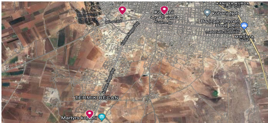
Frappes aériennes turques sur Kobanê, 24.10.2024