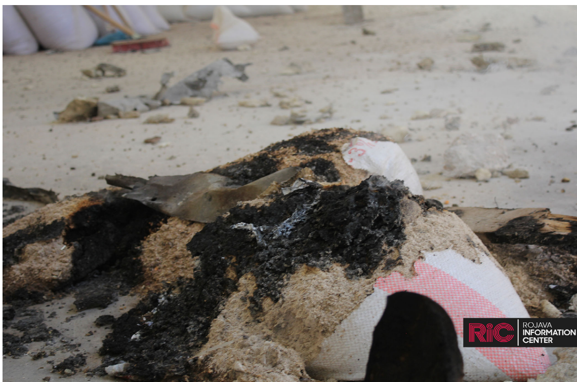
Azienda del Centro di Agricoltura bombardata da droni turchi a Qamishlo 25.10.2024

Oggi, l'ala armata del Partito dei Lavoratori del Kurdistan (PKK) ha rivendicato la responsabilità per l'attacco a un impianto aerospaziale ad Ankara avvenuto il 23 ottobre, dopo il quale è iniziata l'ultima serie di attacchi aerei. DAANES ha rilasciato una dichiarazione in cui accusa la Turchia di "esportare la sua crisi" e denuncia il "silenzio internazionale" che circonda gli attacchi contro infrastrutture civili.