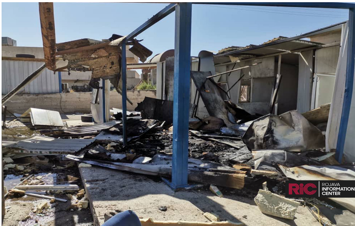
Magazzino di grano bombardato da droni turchi a Kobane 25.10.2024

-Il Centro d'Informazione in Rojava è disponibile per fornire commenti sul campo, oltre a foto e video dai siti degli attacchi aerei e contatti con i rappresentanti politici e con il personale umanitario per un commento.