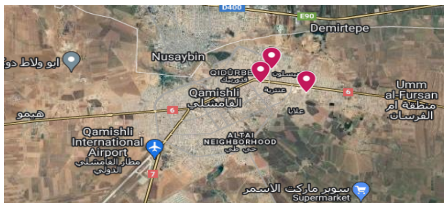
Attacchi aerei turchi su Qamishlo 25.10.2024

1. Centro città, Kobane; 2. Checkpoint di Asayish, Kobane; 3. Giacimento petrolifero di Odeh; 4. Magazzino del grano, Kobane; 5. Checkpoint di Asayish, Derik; 6. Kar Qahfak, Girke Lege; 7. Centro città, Kobane; 8. Società per lo sviluppo agricolo, Qamishlo; 9. Centro Asayish, Qamishlo; 10. Sito industriale di Sadcop, Qamishlo (2); 11. Fabbrica di borse di plastica, Merka Mira; 12. Fattoria, Derik; 13. Besta Sus, Derik; 14. Nelle vicinanze di Qerechoh, Derik; 15. Checkpoint di Asayish, Amude; 16. Centrale elettrica, Tirbespi; 17. Sweidiki, Derik; 18. Incrocio stradale, Qamishlo; 19. Sawan, Ain Issa; 20. Officina per la manutenzione dell'auto, Rimelan.