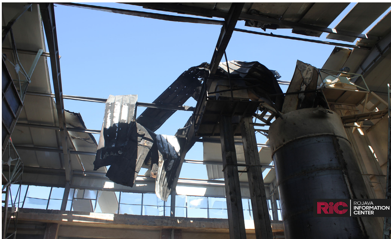
Azienda del Centro di Agricoltura bombardata da droni turchi a Qamishlo 25.10.2024