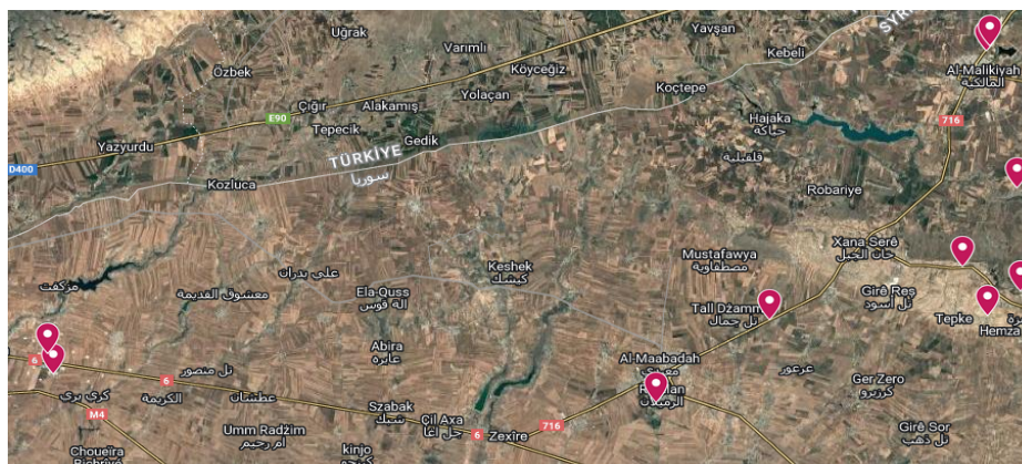
Attacchi aerei turchi su Derik, Rimelan e Tirbespi 25.10.2024

GLI ATTUALI ATTACCHI AEREI TURCHI IN NES PRENDONO DI MIRA ELETTRICITÀ, PETROLIO E ALTRE INFRASTRUTTURE CIVILI: 24-25. OTTOBRE 2024