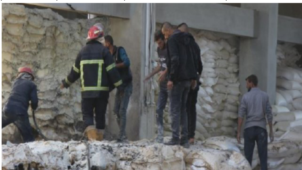
Silos di grano bombardati da droni turchi a Qamishlo 24.10.2024