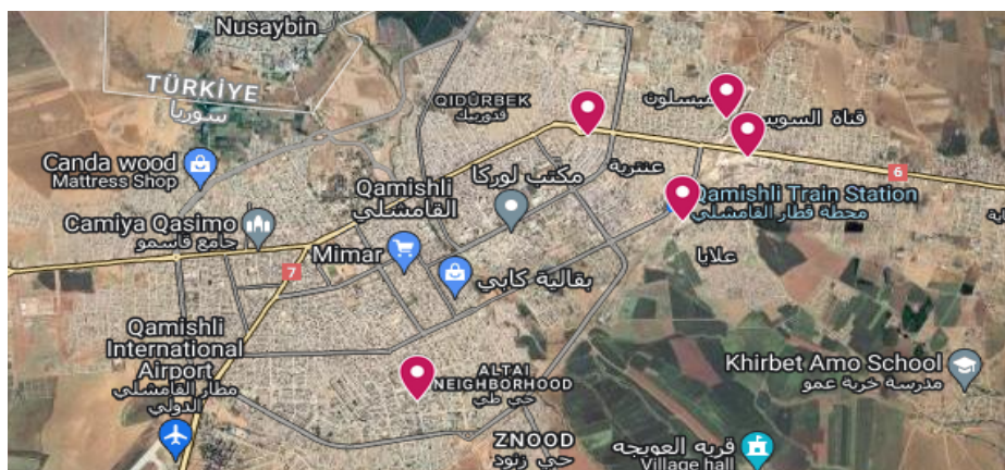
Attacchi aerei turchi su Qamishlo, 24.10.2024

1. Centro Asayish (Forze di Sicurezza Interna), Qamishlo; 2. Clinica sanitaria Khalij, Qamishlo; 3. Checkpoint di Asayish, Qamishlo; 4. Fabbrica alimentare, Kobane; 5. Stazione elettrica, Amude; 6. Merka Mira, Derik; 7. Centrale elettrica di Kobane (3); 8. Sadcop Sito industriale, Qamishlo; 9. Silos per il grano, Qamishlo; 10. Centrale elettrica di Saida, Tirbespi; 11. Panetteria, Kobane; 12. Stazione di gas ed elettricità di Suwaydiyah, Tirbespi; 13. Sito della raffineria di carburante Tafla, Derik; 14. Stazione ferroviaria, Qamishlo; 15. Checkpoint di Asayish, Kobane; 16. Panetteria, Amude; 17. Centrale elettrica, Amude; 18. Nelle vicinanze della Facoltà di Ingegneria del Petrolio e Petrolchimica, Rimelan; 19. Eyin Tewil, Rimelan; 20. Centro Asayish, Qamishlo; 21. Babasi stazione, Tirbespi; 22. Stazione petrolifera di Zarba, Tirbespi; 23. Stazione Awda, giacimento petrolifero di Odeh; 24. Torre Syriatel, Darbasiyah; 25. Campo petrolifero di Odeh, Tirbespi.