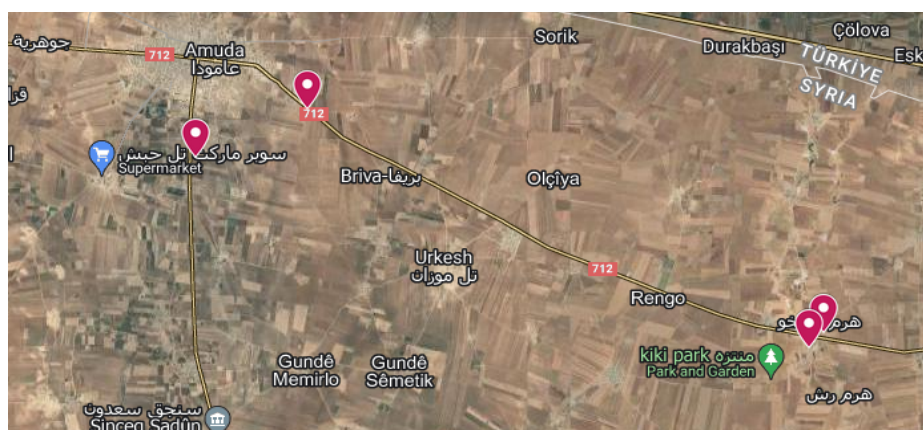
Attacchi aerei turchi su Amude, 24.10.2024