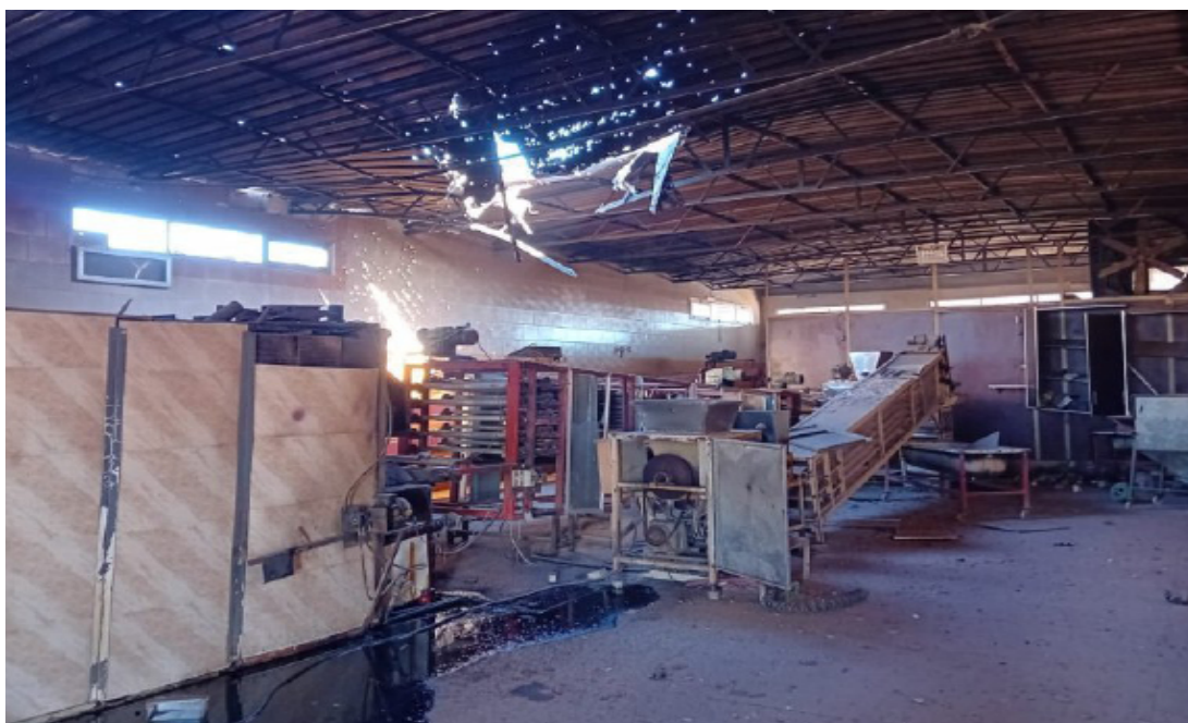
Panetteria ad Amude bombardata da attacchi aerei turchi, 24.10.2024

La Turchia ha avviato questi attacchi aerei a seguito di un attacco ad Ankara il 23 ottobre che le autorità turche hanno attribuito a membri del Partito dei Lavoratori del Kurdistan (PKK). Nessun gruppo ha rivendicato l'attacco. In passato, i rappresentanti militari e politici dell'AANES hanno dichiarato che gli attacchi della Turchia equivalgono a crimini di guerra e hanno disdetto le affermazioni della Turchia secondo cui sarebbe il PKK ad organizzare i suoi attacchi dall'AANES.