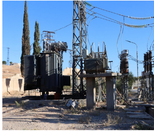
محطة كهرباء كوباني 2024-10-24

نتيجة هذه الهجمات فقد 13 شخصاً لحياتهم، وجرح 16 آخرين، في مناطق متفرقة في إقليم شمال وشرق سوريا، بينهم عضو قوى الأمن الداخلي