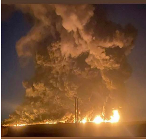
محطة سويدية النفطية 23-10-2024

خرجت محاولة محطة كهرباء كوباني عن الخدمة نتيجة القصف التركي على المحطة. وبينما كانت تتحضر هيئة الطاقة في مقاطعة الفرات بإلقاء بيان، عاودت الطائرات التركية قصف المحطة مرة أخرى. وتم استهداف محطة كهرباء عامودا ثلاث مرات، مرة منها كان يتواجد طاقم إعلامي وتم استهدافهم بواسطة طائرة مسيرة، حسب اتحاد الإعلام الحر.