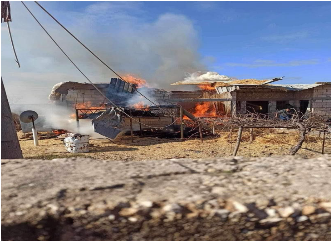
غارة جوية تركية على منزل مدني في كربتلي 14.01.2024

ذكر المركز الإعلامي لقوات سوريا الديمقراطية أن "هذه الهجمات عطلت تقديم الخدمات الأساسية، بما في ذلك الطاقة والكهرباء والمياه وغيرها من الاحتياجات، مما أثر على الآلاف من الأشخاص" ويدعي أن الهجمات "تشكل جرائم حرب صارخة ومتعمدة تهدف إلى التسبب في أقصى قدر من الضرر لحياة المدنيين، وزرع الخوف في قلوبهم، وإلحاق المعاناة بحياتهم اليومية"