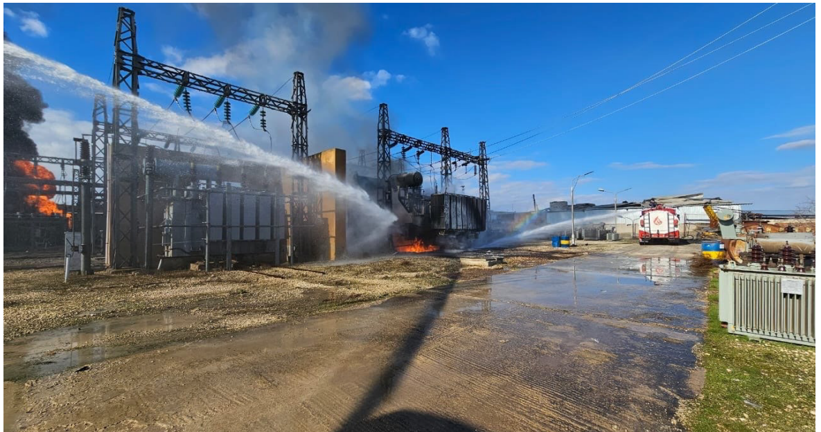
محطة كهرباء كوباني بعد الغارة الجوية التركية، 14.01.2024

مركز معلومات روج آفا متاح لتقديم التعليقات من على الأرض، بالإضافة إلى صور ومقاطع فيديو من مواقع الغارات الجوية والاتصال بالممثلين السياسيين والعاملين في المجال الإنساني للتعليق