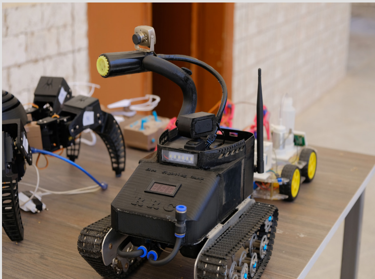
Projectes de final de curs 2022 de les estudiants de Mecatrònica: un robot bomber, una aranya robot i un dron.

Tanmateix, les aspiracions per l'autonomia van més enllà de la part material. Reflectint el valor de l'autonomia del sistema de l'AANES i de la universitat, els professors posen èmfasi en la necessitat de poder desenvolupar els seus propis sistemes tecnològics, lliures de la influència exterior. Durant la visita del RIC a les seves dependències, les professores estaven engrescades en una discussió sobre l'ús de microcontroladors de placa única que ja estan preparats, i la millor alternativa: utilitzar microcontroladors sense programar, programar-los al Departament de Mecatrònica i utilitzar-los per als seus propis fins.