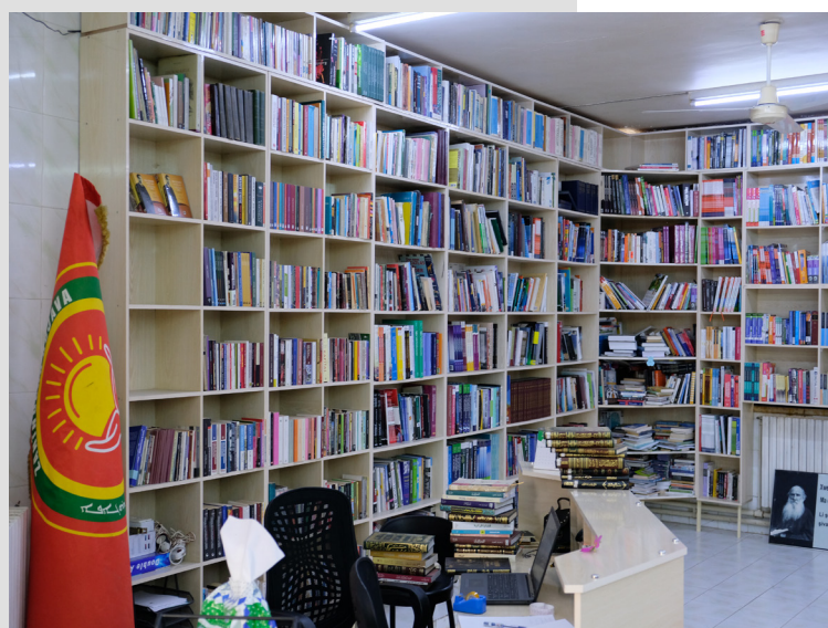
Biblioteca de la Universitat de Rojava

L'alumnat a la Universitat de Rojava necessita un certificat del nivell B1 d'anglès per poder-se graduar i tenir el títol del Grau. Per estudiants de Màster el nivell que es demana és el C1. L'alumnat pot fer 3 hores a la setmana de classes d'anglès i un Centre d'Idiomes que pertany a la universitat ofereix classes als i les estudiants universitaris després de les seves classes. Cada nivell del Marc europeu comú de referència per a les llengües (A1, A2, B1, B2 i C1) es completa després de 30 hores de classe.