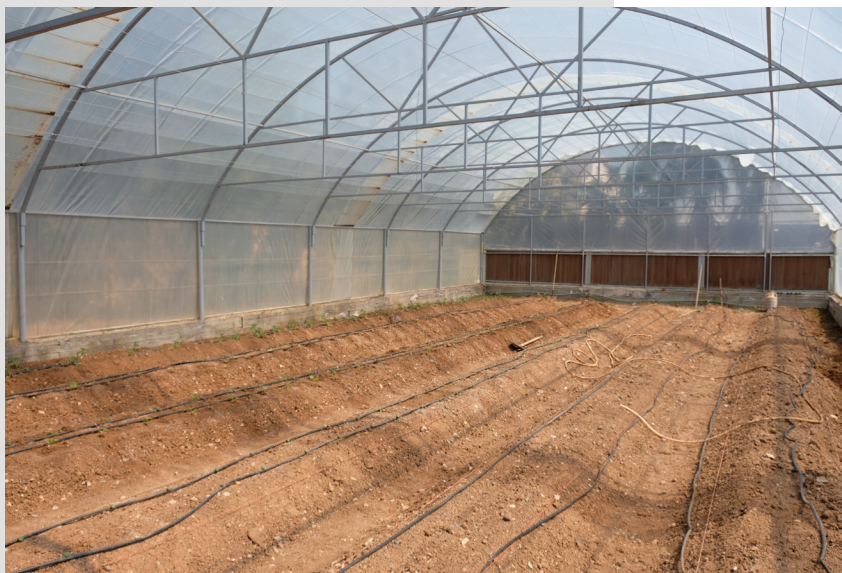
Hivernacle de la Universitat de Rojava, ubicat al campus de Qamishlo.

El sòl de la zona de cultiu del campus de Qamishlo està obert a que l'alumnat experimenti i hi dugui a terme les seves pròpies activitats de recerca. Els i les estudiants de quart d'enginyeria agrícola fan la seva recerca a l'hivernacle principal. Allà poden experimentar amb la producció d'aliments i d'aquesta manera han creat cultius de gírgoles ( Pleurotus ostreatus ).