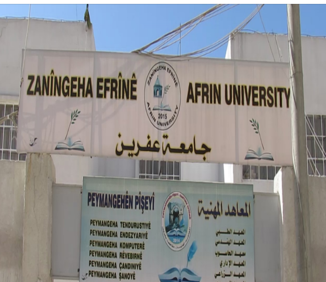
La Universitat d'Afrin va ser inaugurada el 2015 i va ser obligada a tancar quan Turquia va invadir la regió el 2018. Actualment l'edifici acull el Consell d'Afrin, un govern pròxim de Turquia a la regió.