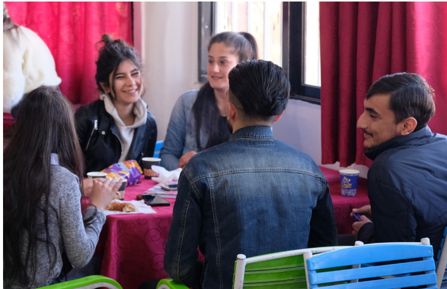
Estudiants disfrutant d'un cafè a la cafeteria de la Universitat de Rojava.

Les universitats del NES estan obertes per a totes les persones que viuen al NES. Els candidats a estudiants han de presentar la seva sol·licitud a través del departament d'educació i se'ls convida a fer un examen estandarditzat basat en les seves notes de batxillerat, que determina a quins cursos poden accedir. L'examen d'accés -que dura al voltant de 3 hores - es pot fer a totes les universitats del NES, així com en un centre d'exàmens addicional a Shehba, el territori al nord d'Alep controlat per l'AANES. L'examen pot ser o bé un examen general de ciències o d'humanitats, depenent de la tria del sol·licitant. Les preguntes de l'examen es proporcionen en kurd i àrab i s'accepten les respostes en qualsevol de les dues llengües. El resultat de l'examen determina si les persones sol·licitants són acceptades als cursos que volen. Per cursar Traducció Anglesa, és necessari a més fer un examen de competència en anglès. Una vegada l'estudiant ha estat acceptat o acceptada al sistema universitari del NES poden triar lliurement a quina de les tres universitats del NES volen estudiar. Segons el Comitè de Coordinació de les Universitats, l'òrgan de l'AANES que organitza aquestes universitats, 2.624 estudiants van fer l'examen d'accés per al curs acadèmic 2021-2022. D'aquests, 1.640 ho van fer a Qamishlo, 637 a Kobane, 86 a Shehba i 261 a Raqqa.