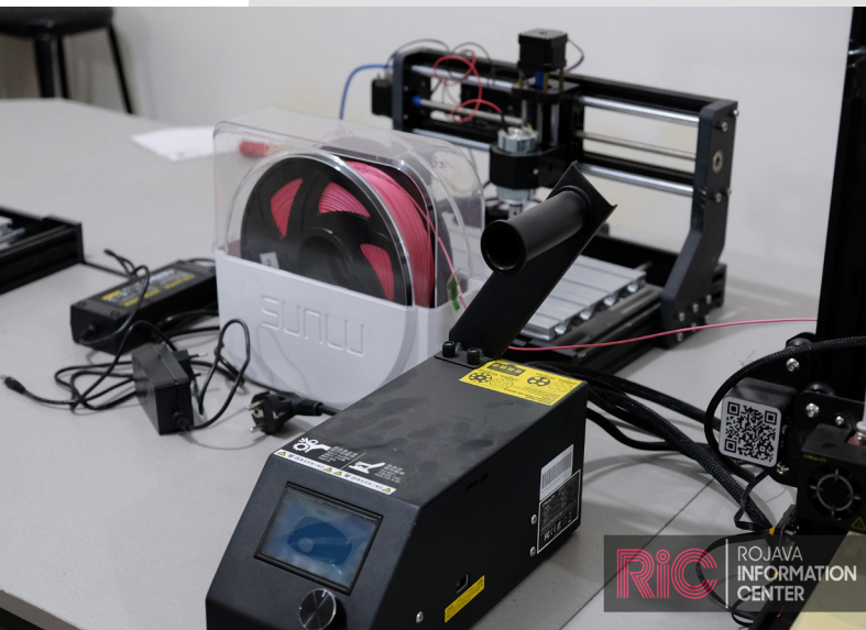
Impressora 3D al Departament de Mecatrònica a la Universitat de Rojava.