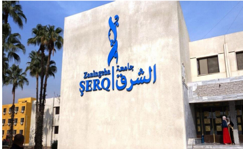
Entrada de la Universitat Al-Sharq a Raqqa. Al fons es veu una residència estudiantil.