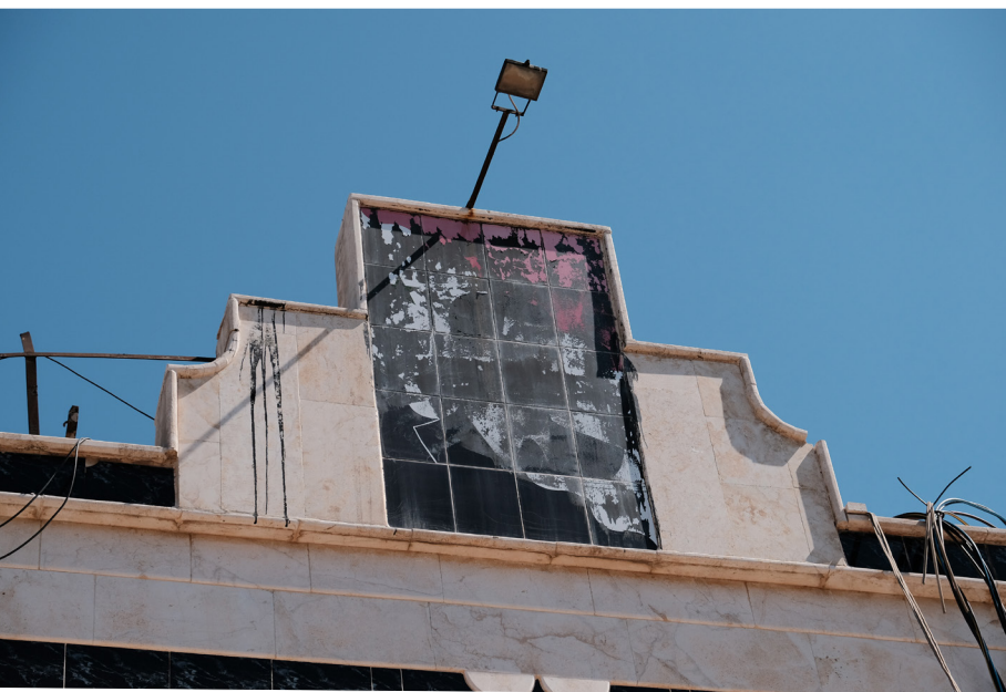
Una foto esborrada del president Bashar al-Assad al campus de Qamishlo de la Univeristat de Rojava deixa entreveure l'antic ús de l'edifici, utilitzat pel govern sirià com a Institut d'Agricultura.

Tal com a la resta de la societat del NES, la universitat s'organitza a través de consells i comitès. Els consells autònoms de dones també hi són presents, juntament amb els consells d'estudiants i representants de l'alumnat de cada