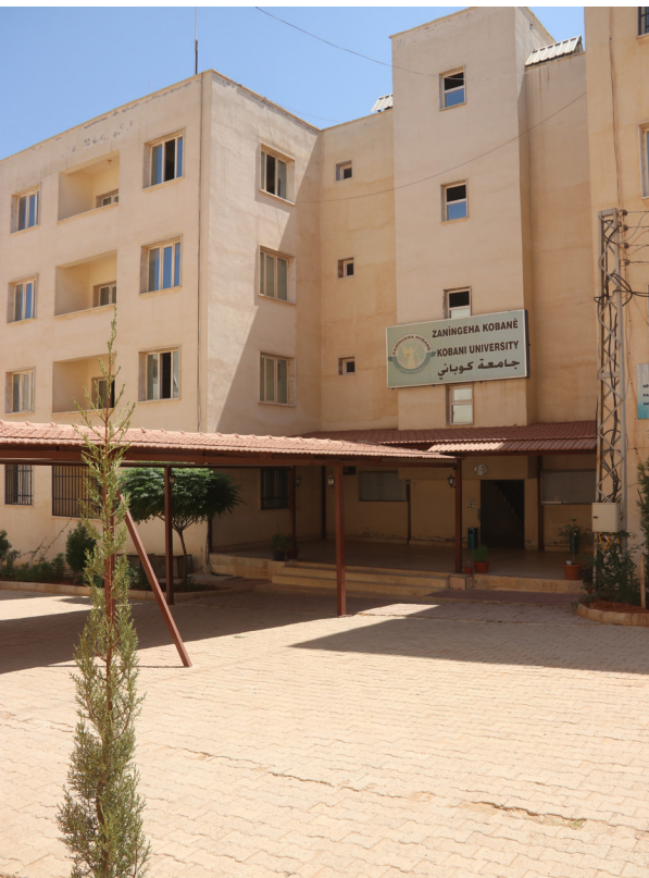
Entrada a la Universitat de Kobane l'estiu del 2022. A principis del 2023 la universitat es mourà a un altre edifici i les seves antigues sales s'utilitzaran per allotjar a l'alumnat de fora la ciutat.

Desenes de professors i professores d'arreu del món han fet classes online i alguns d'aquests han vingut al NES a fer classes presencials, segons la direcció de la universitat. En altres departaments també s'ofereixen programes similars amb professorat convidat, tot i que s'han de formalitzar a través d'institucions d'educació superiors estrangeres. A Kobane, la majoria del professorat del seu Master ensenyen online, segons l'administració de la universitat.